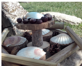
Équilibre, superpositions et alternance de couleurs.

Si, lors des premières séances de découverte, les créations ne sont pas particulièrement organisées, les élèves seront amenés par la suite à faire des choix judicieux et réfléchis : choix des matériaux en fonction de l'objectif recherché, choix des couleurs (alternance clair/foncé), choix des meilleurs dispositifs (superposer, aligner...), etc. Dans un même temps, ils devront montrer qu'ils sont capables de réinvestir des techniques apprises, remobiliser des connaissances tout en faisant preuve d'imagination .