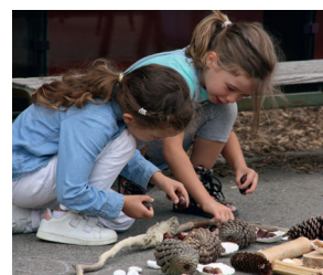
Élèves de début de MS et de fin de GS.

Toutefois, sachez que le Land Art se pratique à tout âge, même avec des plus jeunes ! En PS, on ciblera plus les activités sur les matériaux, le tri, les superpositions, les rythmes, etc. Avec des plus grands, bien après le CP, les possibilités de création seront infinies !