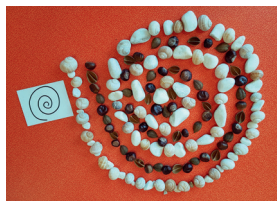
Reproduction précise d'un graphisme, alternance de matériaux (rythmes).

Les élèves doivent être capables de maitriser leur geste pour positionner correctement leurs éléments, notam-