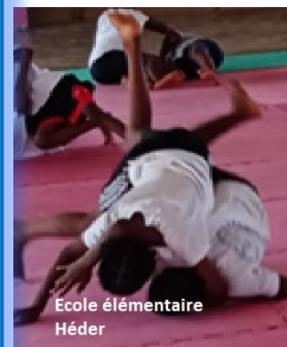
Ecole élémentaire Héder

De la PS en Maternelle au CM2, les enseignants ont permis à leurs élèves de pratiquer diverses activités physiques allant du sport discipline (judo, escrime, cyclisme, handball ...) aux jeux plus traditionnels (les chaises musicales, la course en sac, les garçons de café ...) en passant par des activités physiques plus artistiques (danse, zumba, capoeira ...)