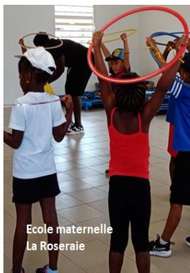
Ecole maternelle La Roseraie