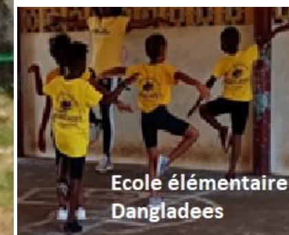
Ecole élémentaire Dangladees