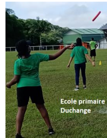
Ecole primaire Duchange