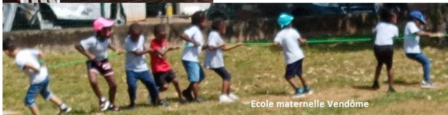
Ecole maternelle Vendôme