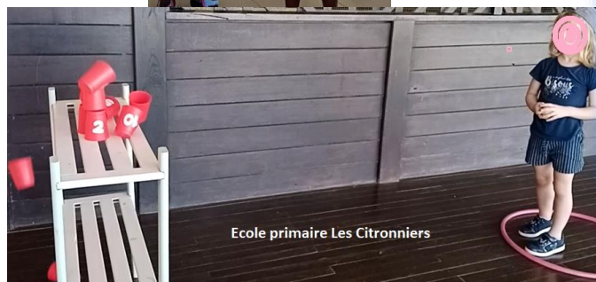
Ecole primaire Les Citronniers

De la PS en Maternelle au CM2, les enseignants ont permis à leurs élèves de pratiquer diverses activités physiques allant du sport discipline (judo, escrime, cyclisme, handball ...) aux jeux plus traditionnels (les chaises musicales, la course en sac, les garçons de café ...) en passant par des activités physiques plus artistiques (danse, zumba, capoeira ...)