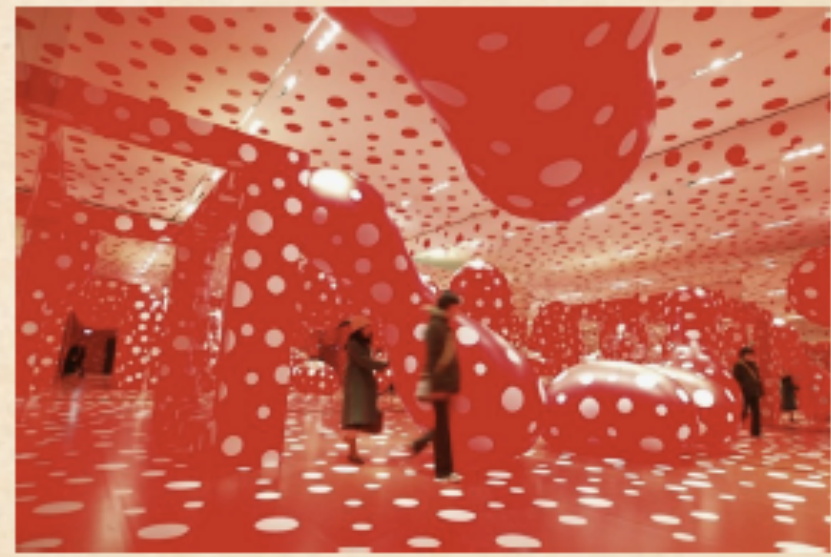
Les poids de l'artiste japonaise Yayoi Kusama semblent se propager comme un virus.