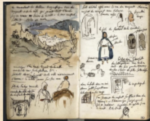
Eugène Delacroix Carnets de voyage au Maroc 1832